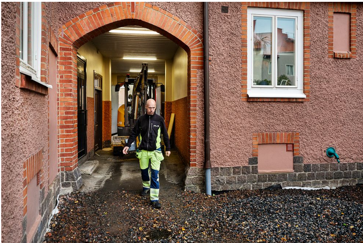
Volvo ECR25 Electric är tillräckligt kompakt för att ta sig in på innergården.

I samband med anbudsförfarandet lade Posedion fram önskemålet att projektet skulle genomföras fossilfritt. Det tog Anlab, Anläggningsbolaget Väst AB, på allvar och investerade bland annat i en ny Volvo ECR25 Electric för själva grävjobbet.